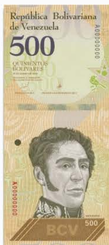
Simón Bolívar (1783 - 1830) Padre de la patria venezolana, nació el 24 de julio de 1783, en Caracas. Reconocido mundialmente como el fundador de la República de Colombia y Bolivia, es la figura más destacada de la emancipación con visión integracionista del continente latinoamericano.

Con la Reconversión circulará una nueva familia de especies monetarias, conformada por 8 billetes (Bs.S 2, Bs.S 5, Bs.S 10, Bs.S 20, Bs.S 50, Bs.S 100, Bs.S 200 y Bs.S 500) y dos monedas (50 céntimos y Bs.S 1) que sustituirán al actual cono vigente.