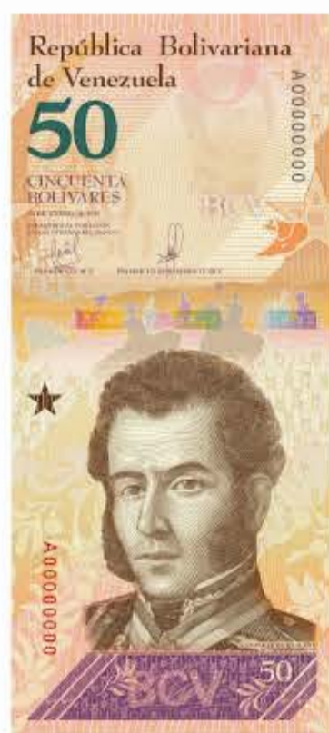
Antonio José de Sucre (1795 - 1830) El Gran Mariscal de Ayacucho nació en Cumaná, el 3 de febrero de 1795. Al estallar la guerra de Independencia, se sumó a las fuerzas republicanas y sirvió a las órdenes del generalísimo Francisco de Miranda. Luego del Congreso de Cariaco, siguió a Bolívar hasta Boyacá para liberar a la Nueva Granada.