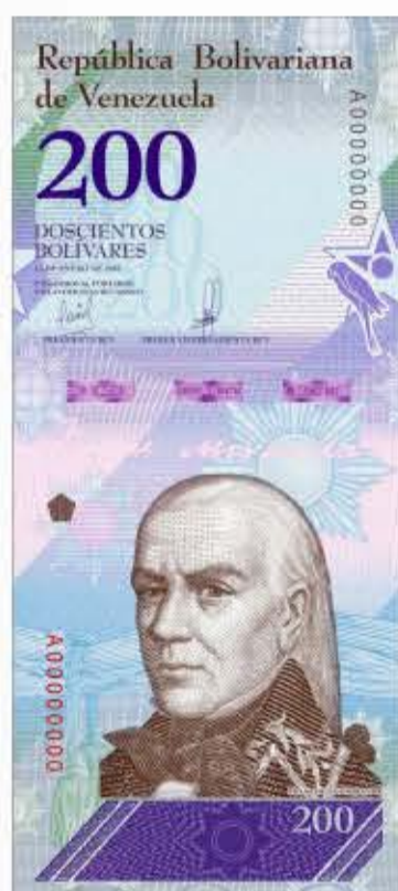
Francisco de Miranda (1750 - 1816) Destacado político, intelectual y estratega militar. Nació el 28 de marzo de 1750, en Caracas. Precursor de la emancipación americana y revolucionario de tres mundos, es reconocido como el venezolano más universal.